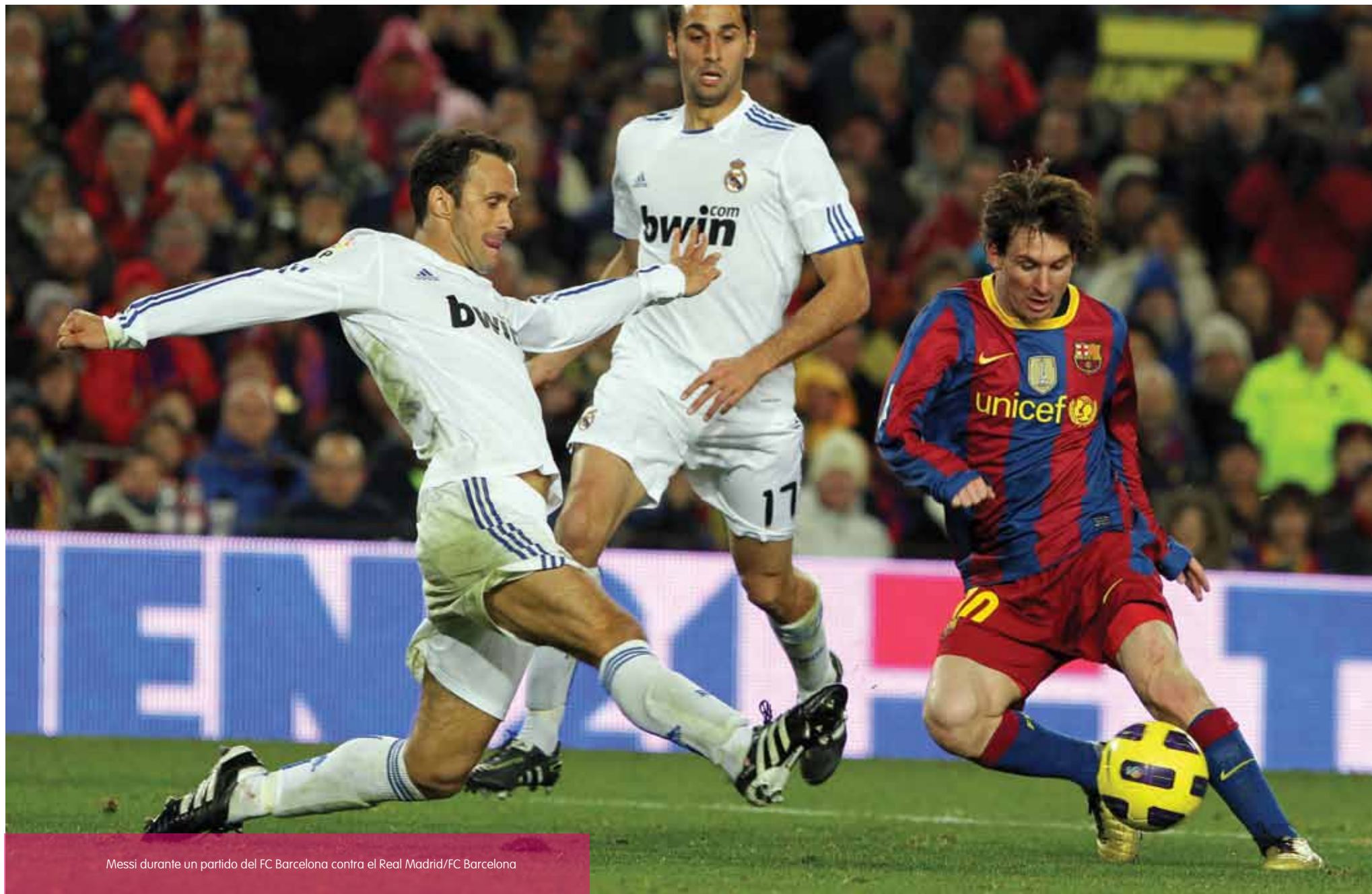
Messi durante un partido del FC Barcelona contra el Real Madrid