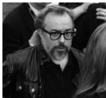
Álex de la Iglesia