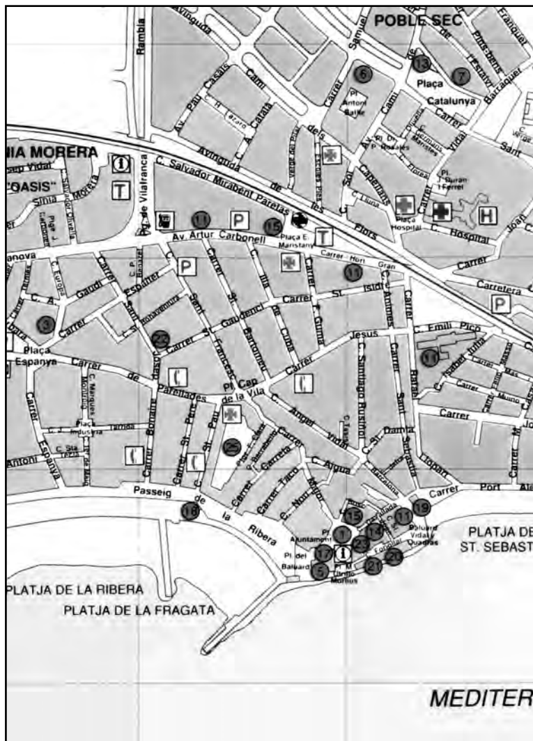
Centro de Sitges